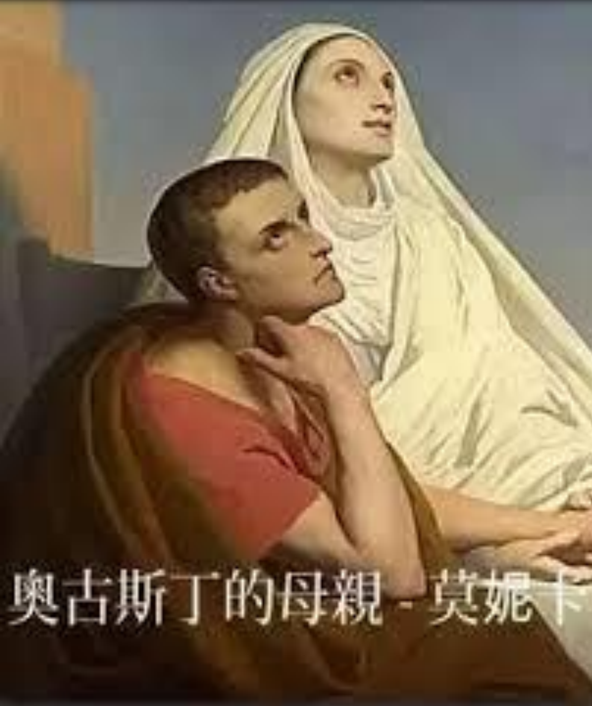
奥古斯丁的母亲 - 莫妮卡